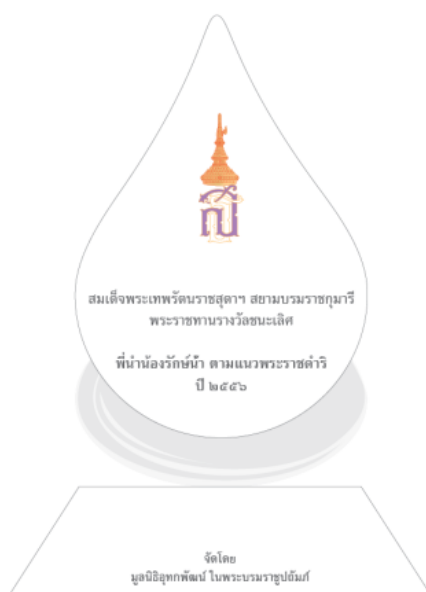
ภาพถ่ายตัวอย่างโล่รางวัลพระราชทาน