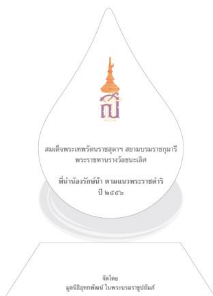
ภาพตัวอย่างโล่รางวัลพระราชทาน

รางวัลชนะเลิศ โล่พระราชทานจากสมเด็จพระเทพรัตนราชสุดาฯ สยามบรมราชกุมารี พร้อมเกียรติบัตรแสดงความยินดี และเงินรางวัล จำนวน 50,000 บาท (จำนวน 1 รางวัล)